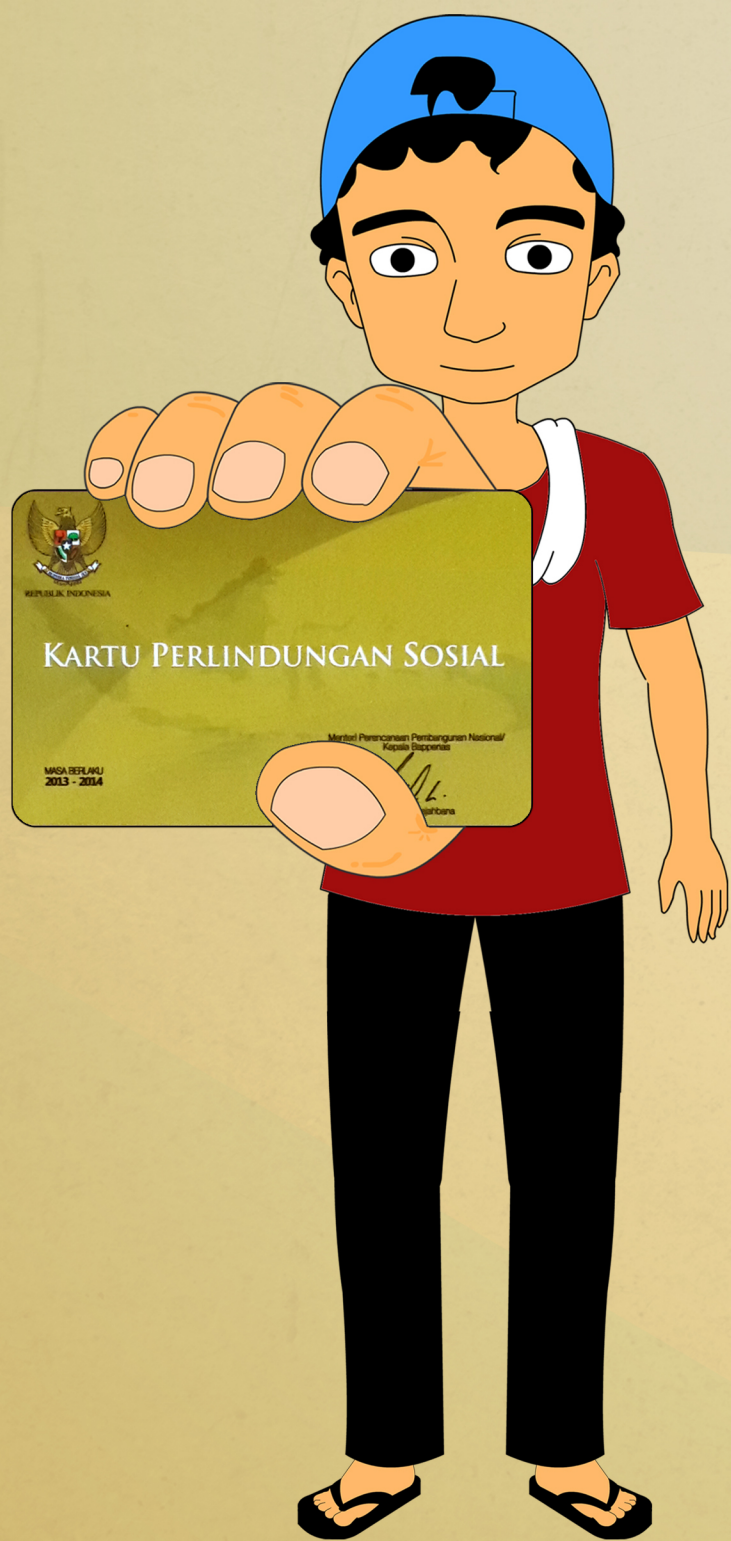
KPS adalah kartu penanda 15,5 juta keluarga kurang mampu